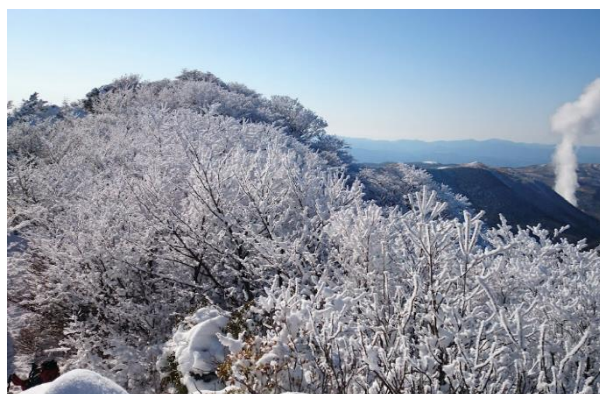
沓掛山の霧氷（九重町）