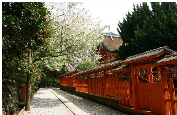
早吸日女神社（大分市）