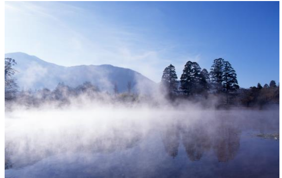
金鱗湖 朝霧（由布市）