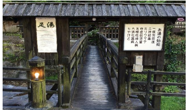
宝泉寺温泉（九重町）