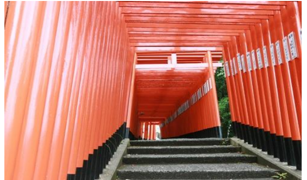
扇森稲荷神社（竹田市）