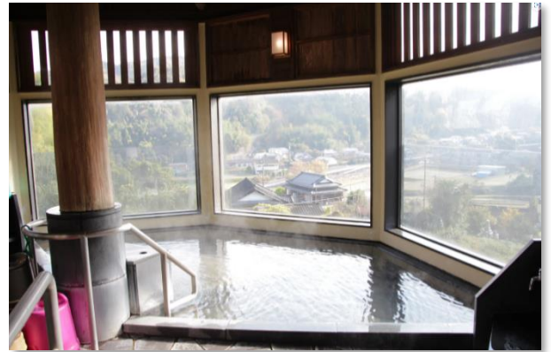
西谷温泉公園（中津市）