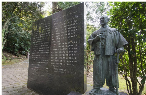
大友宗麟墓地公園（津久見市）