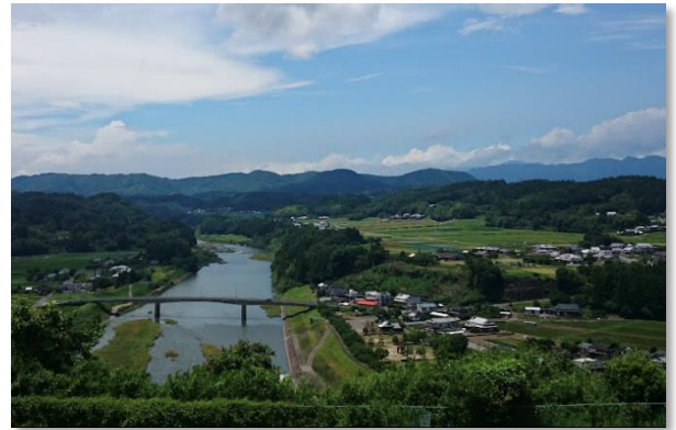
江内戸の景（豊後大野市）