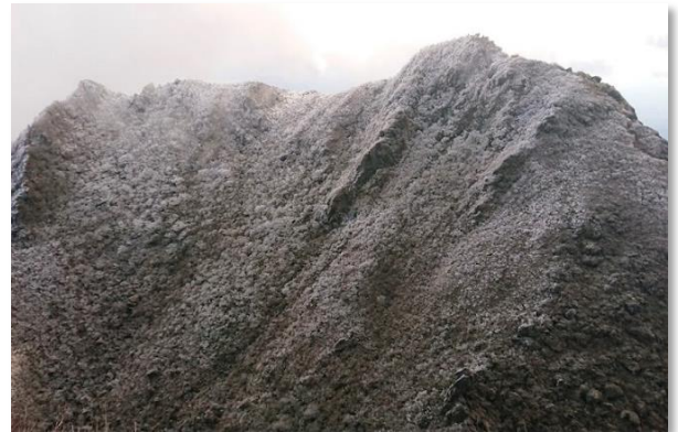
由布岳東峰（由布市）