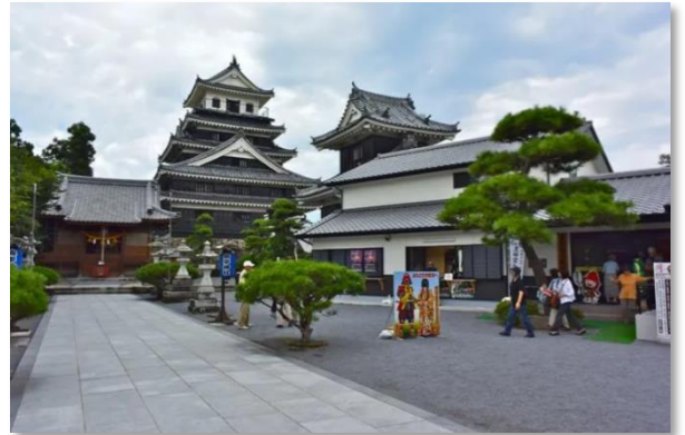
中津大神宮・中津神社