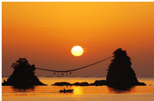
豊後二見ヶ浦 (佐伯市)