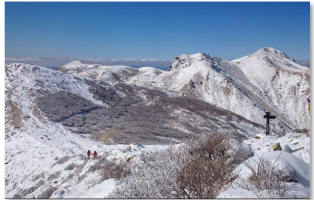
冬の九重連山(竹田市)