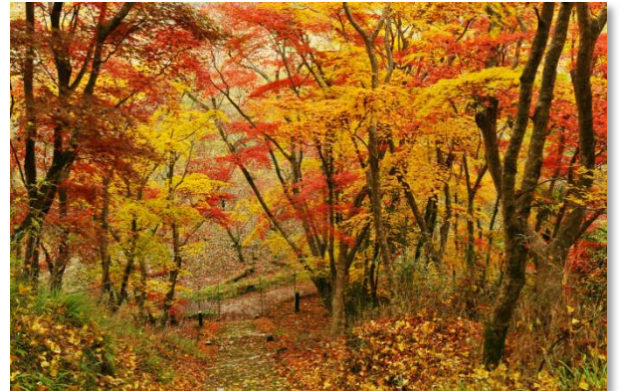
御霊もみじ(御霊神社) (中津市)

中津所管内では、 株式会社 中津カントリークラブ 医療法人 向心会 大貞病院 が表彰されました!