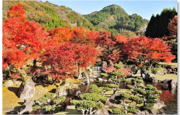
溪石園の紅葉（中津市）