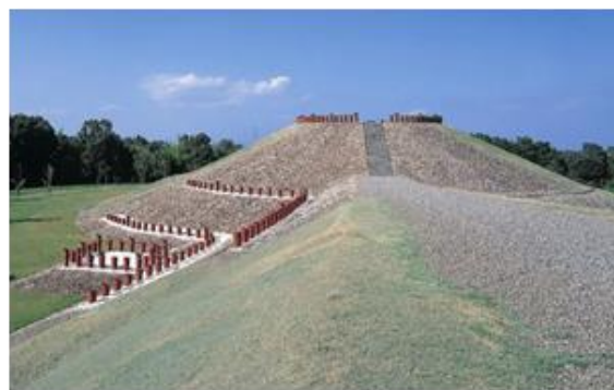
亀塚古墳公園（大分市）