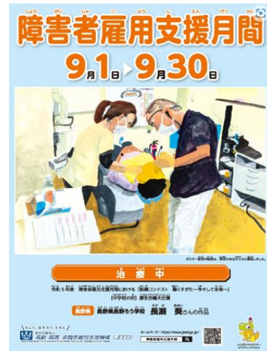
<前年度の障害者雇用支援月間ポスター>

詳しくは、独立行政法人高齢・障害・求職者雇用支援機構（JEED）のホームページへ https://www.jeed.go.jp/