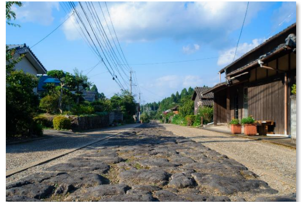
参勤交代道路 今市石畳道（大分市今市）