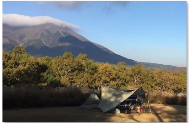
泉水山とキャンプ場(九重町)