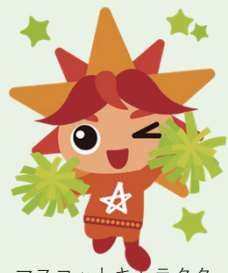
マスコットキャラクター アビリス