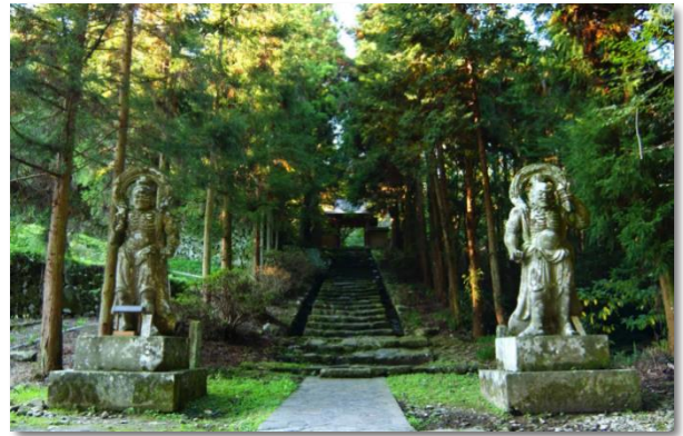
両子寺仁王像（国東市）