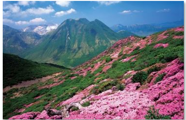
平治岳のミヤマキリシマ（竹田市）