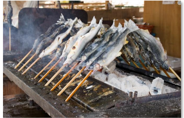
三隈川鮎やな場の鮎（日田市）