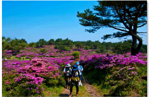
万年山のミヤマキリシマ（玖珠町）