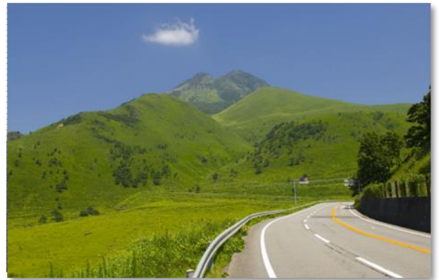
新緑の由布岳（由布市）