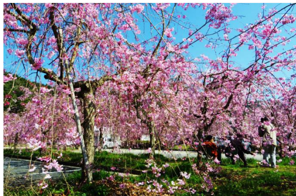
しだれ桜(道の駅耶馬トピア)