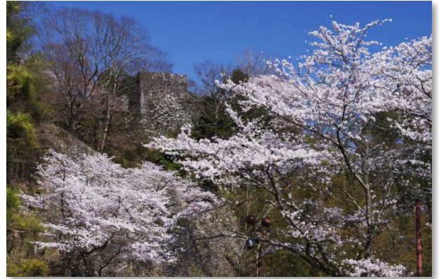
岡城跡の桜(竹田市)