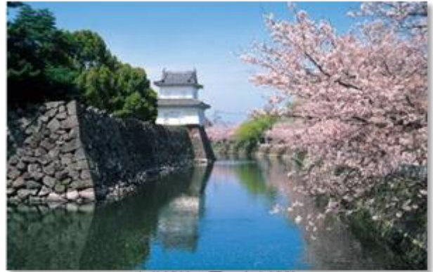
大分城址公園・府内城跡