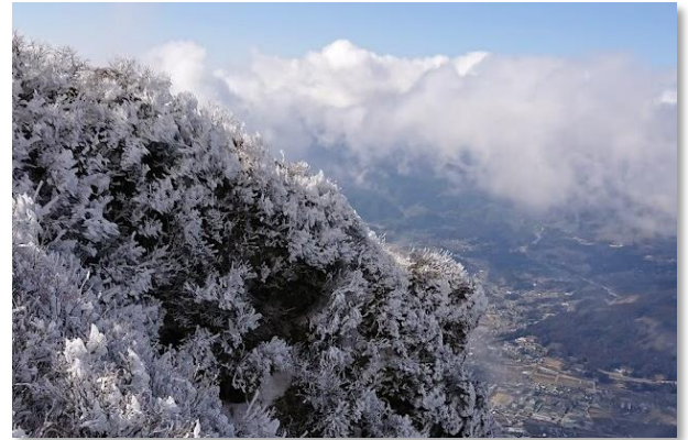
冬の由布岳（由布市）