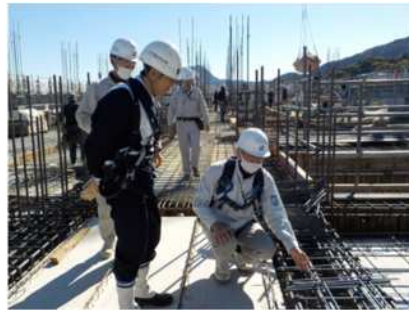
【配筋作業の説明を受ける署長】

11月14日、監督署長による現場パトロールを実施しました。この日の現場は杉乃井ホテル新棟新築工事の現場で、躯体は9階まで建ち上がっていました。