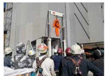
【墜落実験を観察する作業員の方々】

また、胴ベルトとフルハーネスの墜落した時の落下距離や衝撃度の違いの実験、フルハーネスの装着体験も行われていました（写真右）。