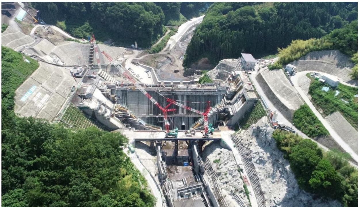
令和3年6月の状況