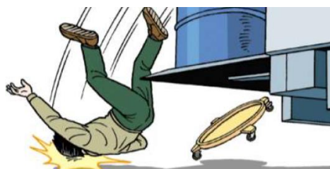
テールゲートリフターから墜落