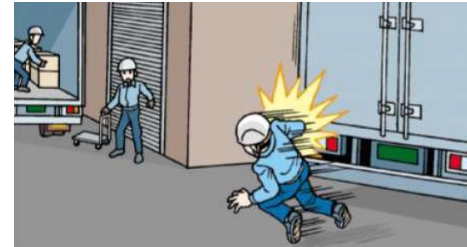
荷役作業指示中に、後退してきた別のトラックに接触