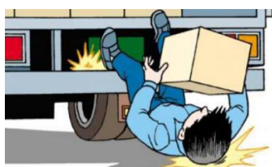
足を滑らせてリアバンパーから墜落