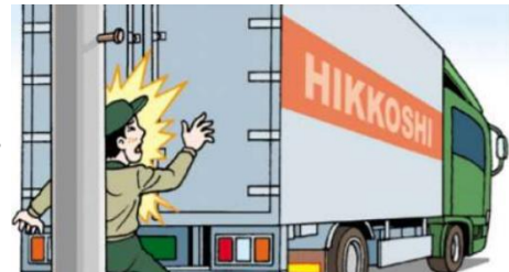
後退誘導時にトラックと電柱との間に挟まれる