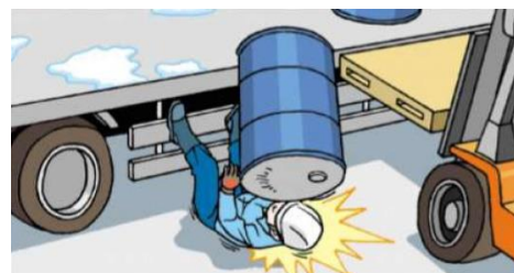
ドラム缶とともに転落し、被災者直撃