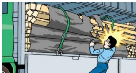
固定ベルトを外した途端に木材が落下