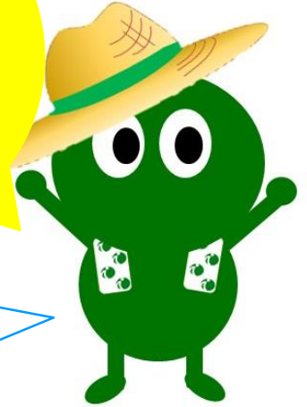
大分県内ハローワーク マスコットキャラクター「湯〜ちゃん」

志望動機も大切ですが、会社は受験者が「どのような人」で「どのような考え方」を持っているのかが、一番知りたいのでは、思います。