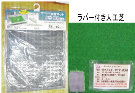
ラバー付き人工芝

玄関先・通路などに滑り防止マットを設置して転倒予防をお願いします。また、従業員から滑りやすい場所を確認しておくことも重要です。滑り防止マットはホームセンターなどでご購入できます。