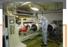
印刷現場の 機械オペレーター