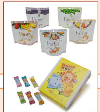
同社デザインの商品

機械操作を覚え、一定品質の作業ができ、安全面での配慮ができていないかなどを判断し、所属長が推薦。派遣社員の場合、本人から派遣元に相談してもらい、派遣元が受諾すれば正社員転換日を調整する。