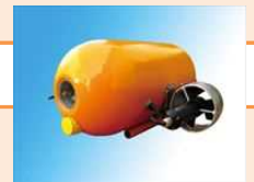
超低価格小型水中ロボット