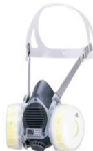
取替え式防じんマスク