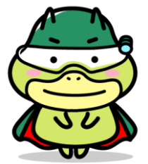
労働基準局広報キャラクター 「たしかめたん」

労働基準法令に基づいてあらゆる事業場に立ち入り、事業主に対し法に定める基準を遵守させることにより、労働条件の確保・向上、働く人の安全や健康の確保を図ることを任務とする厚生労働省の専門職員です。