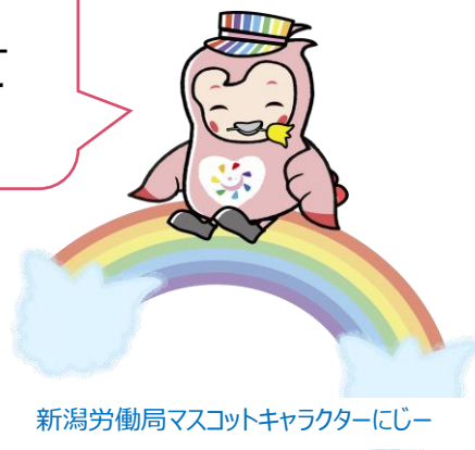
新潟労働局マスコットキャラクターにじー