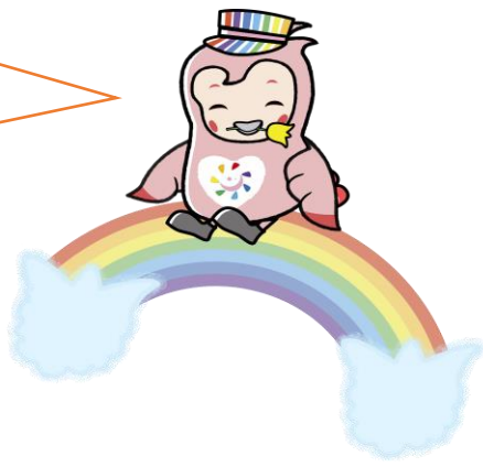
新潟労働局マスコットキャラクターにじー