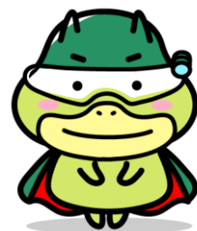
労働基準局広報キャラクター 「たしかめたん」

労働基準法令に基づいてあらゆる事業場に立ち入り、事業主に対し法に定める基準を遵守させることにより、労働条件の確保・向上、働く人の安全や健康の確保を図ることを任務とする厚生労働省の専門職員です。