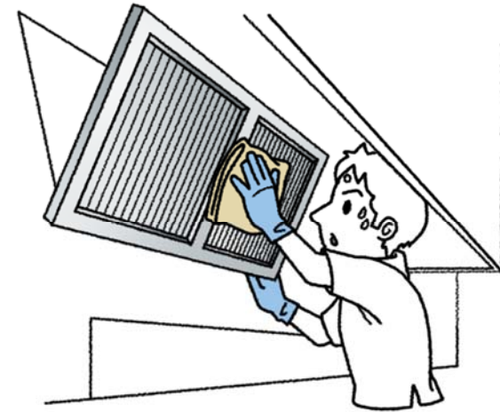
グリスフィルターの清掃