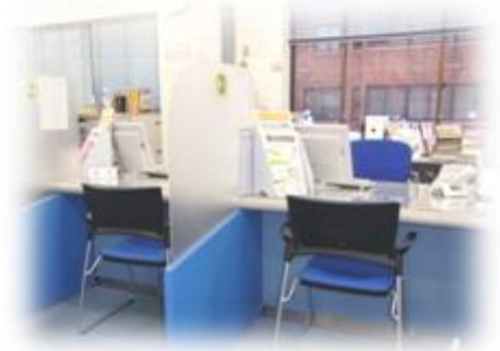
広々とした相談窓口