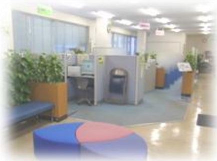
明るく開放的な館内