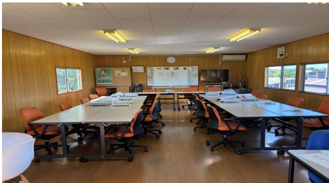
【新幹線点呼事務所】