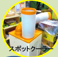
スポットクーラー