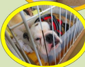
我が社の看板犬 ぶーちゃんとおとちゃんです