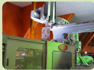
②自動機により成型(数十秒単位で製品が成型されます)