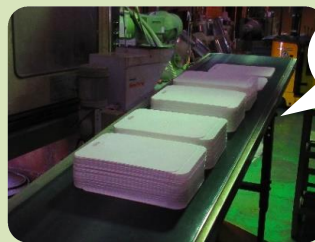
③出来上がった製品をまとめ、次のライン(次工程や、梱包など)へ移動します。