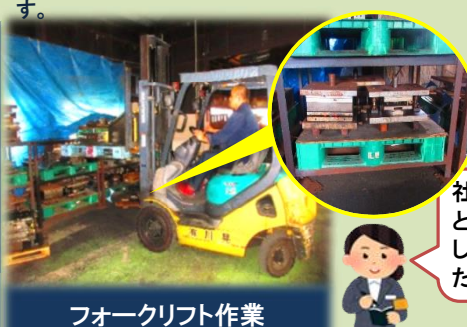
フォークリフト作業