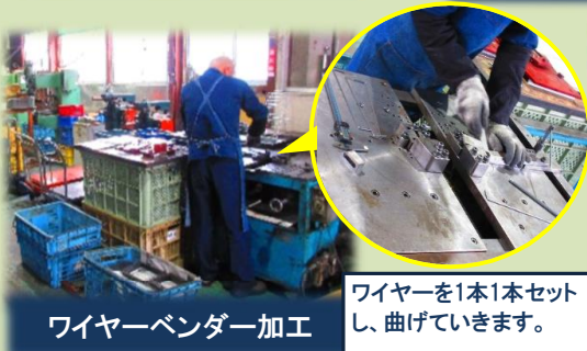
ワイヤーバンダー加工