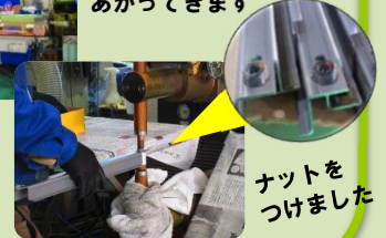
ネットをつけました