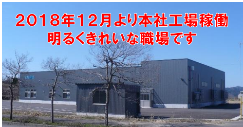
長岡市新陽1丁目17番地