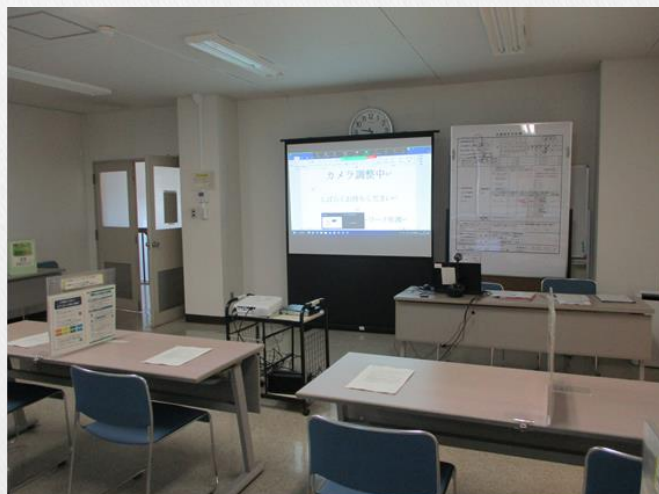
Zoomを用いた場合の開催イメージ

参加される求職者は、ハローワークへ来所するかご自身でZoomのミーティングルームに入室するか選択可能となっています。