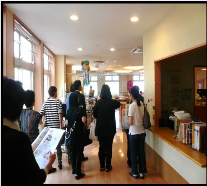
ジョブツアーで介護施設を案内する様子