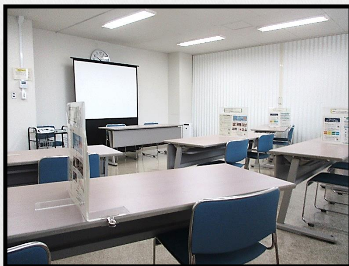
ジョブ・セッション開催イメージ