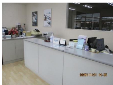
事務所内の様子です